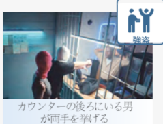
AI駆動のコンテキスト認識

エッジAI処理とコンテキスト分析を統合することで、セキュリティ監視を革新します。本ソリューションは、従来のNVRインフラを、ローカル処理およびリアルタイム検出を備えたAIカメラによって置き換えます。多様な監視ニーズに対応するため、ネットワークビデオシステム (NVS) は、高度なAI機能を提供し、すべての ONVIF対応カメラをサポートします。さらに、エンタープライズグレードのRAIDストレージにより、信頼性の高い映像データ管理を実現します。NVS接続のONVIFカメラを一元管理し、スケーラブルでインテリジェントなコンテキスト認識を提供します。