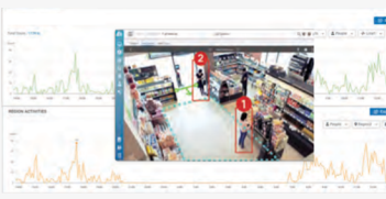
人数及び車両数カウント